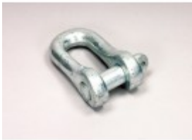
Schäkel 1,0 t, Normal Form A