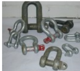
Schäkel 20,0 t, Normal Form A