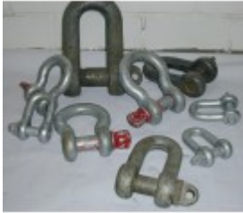
Schäkel 6,0 t, Normal Form A