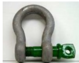
Schäkel 17,0 t, Omega Form A