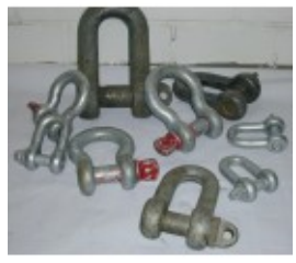
Schäkel 5,0 t, Normal Form A

GT-Geratechnik GmbH Boschstraße 48 4600 Wels, Österreich www.geraete.com