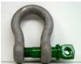
Schäkel 13,5 t, Omega Form A