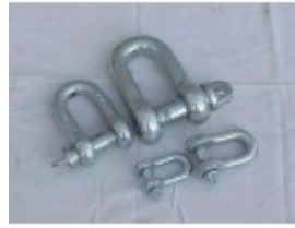
Schäkel 0,6 t, Normal Form A