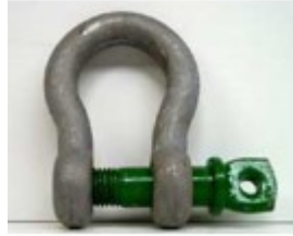
Schäkel 32,0 t, Omega Form A