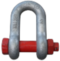
Schäkel 35,0 t, Normal Form D